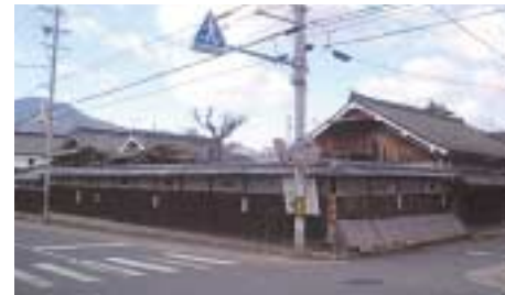
前田邸 国登録有形文化財

DATA 開館時間 / 9:30 ~ 16:30 休館日 / 月曜日 問合せ先 / ☎0736-44-1401