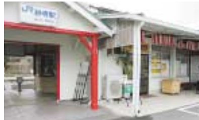
伊都観光物産センター 「妙寺駅マルシェ」

JR妙寺駅舎を店舗として、かつらぎ町商工会員有志が設立したお店。観光案内や観光情報の提供、地域特産品の展示販売のほか、うどん・たこ焼きなどが食べられる食事コーナーもあります。