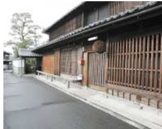
初桜酒造 国登録有形文化財

DATA 営業時間 / 9:00 ~ 17:00 定休日 / 水曜日、土曜日 問合せ先 / ☎0736-22-5670