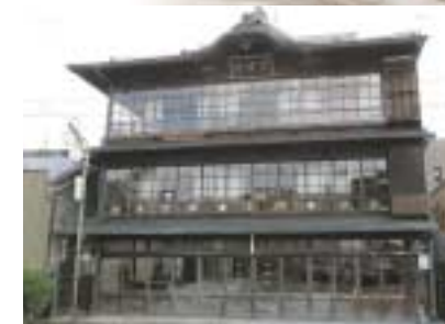
葛城館 国登録有形文化財

DATA 開館時間 / 10:00 ~ 15:00 開館日 / 日曜日 入館料 / 無料 問合せ先 / 橋本市観光案内所 ☎0736-33-3552 高野口町商工会 ☎0736-42-2943