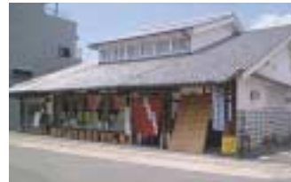
IT地域交流センター

和歌山県は日本一の柿産地であり、中でも紀北地域の特産品となっています。その柿果実を利用した「柿酢」には、カリウムやポリフェノールが豊富で、最近では健康飲料としても注目されています。 問合せ先 / ☎0736-22-0058