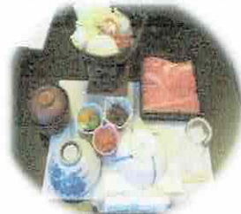
【昼食は近江牛すき焼き】

昼食は近江牛のすき焼きを食べ、日頃の疲れを癒し身も心もリラックスできた一日となりました。