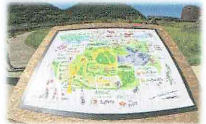
【ラ・コリーナ近江八幡にてお買い物】