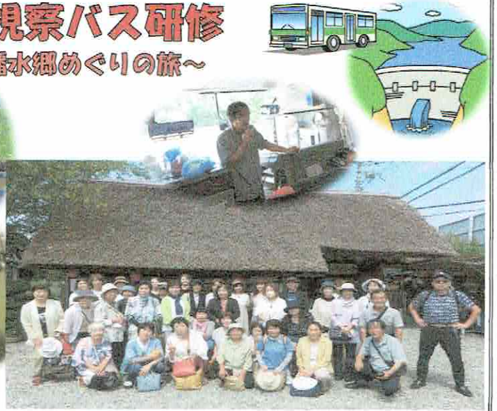
【近江八幡水郷めぐり 手漕ぎ船60分コース】

文化庁主催による視察バス研修で、今年度は滋賀県近江八幡方面に行き、『日本で一番おそい乗物』といわれている手漕ぎ船に乗り、豊年橋を発着する水郷めぐりを体験しました。自然の中をゆっくりゆっくりと進み、乗り心地がとてもよく、穏やかでほっと落ち着く優しい時間にとっても癒されました。