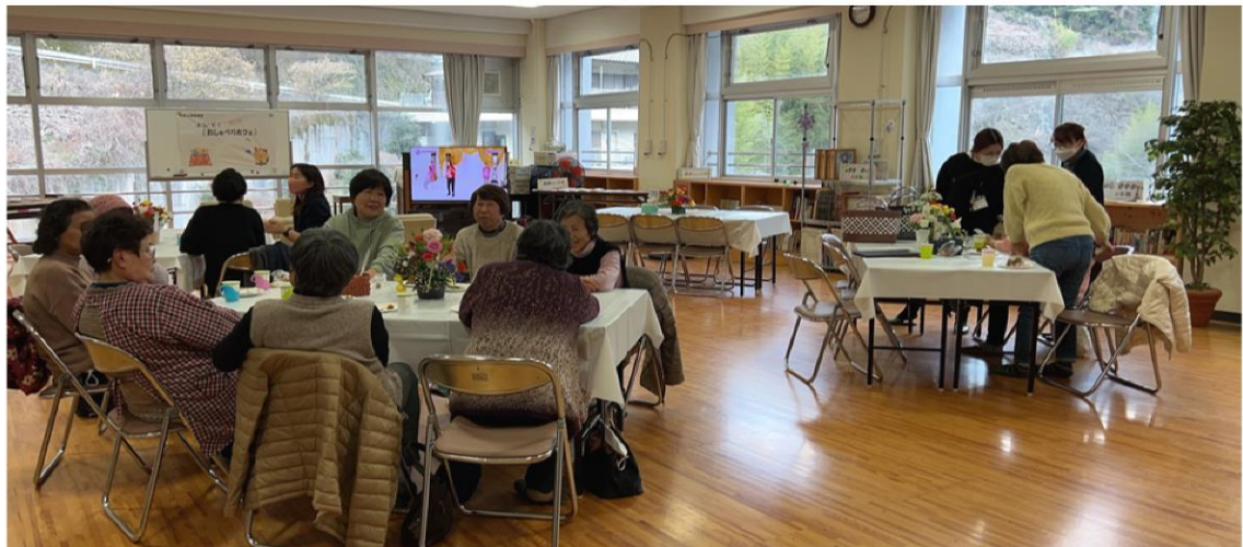
体操の後のひと時