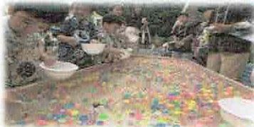
↑ スーパーボールすくい