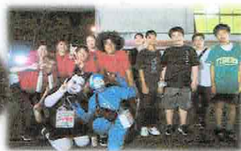
↑ TMB45サークル 四郷の盆踊りサークルさんです!