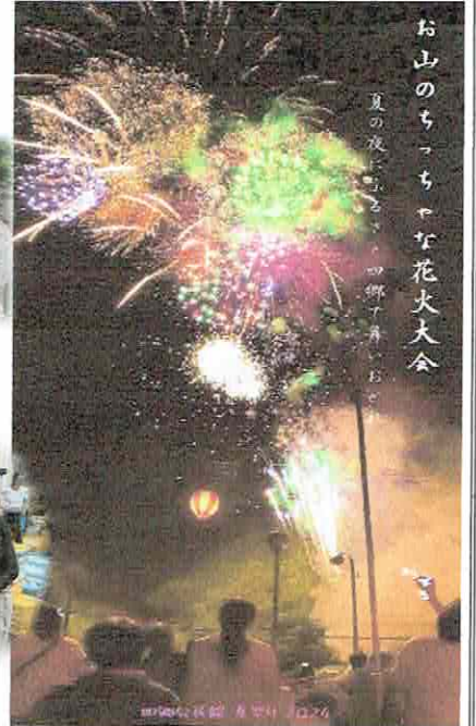
お山のちっちな花火大会 夏の夜にふるさと、四郷で舞いおどれ