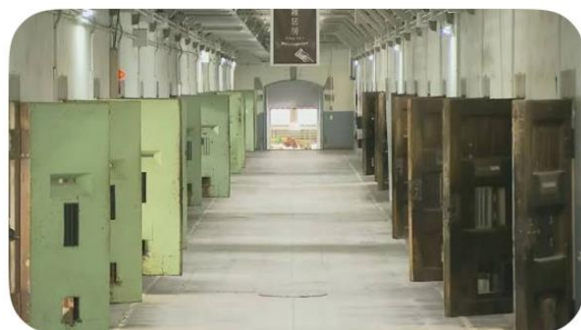
日本初の監獄ホテル 星野…

奈良県明日香村にある7世紀初頭に築造された日本最大級の横穴式石室を持つ方墳です。推定2300トンの巨石を積み上げた石室が露出した姿が有名で時の権力者蘇我馬子の墓と推定され、国の特別史跡に指定されています。