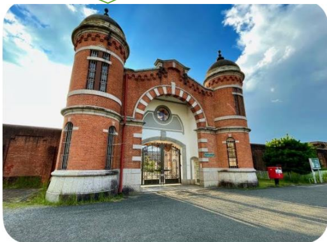
国の重要文化財となった…

情報先取りで仮押さえができましたのは、とてもラッキーです！ぜひ参加お待ちしております。主な行き先は変わりませんが、少し検討中です！