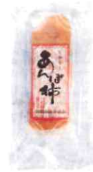
0002 あんぽ柿 3玉 150g 500円(税込)