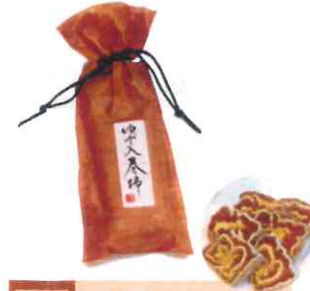
0003 ゆず入巻柿 1本 1,200円(税込)