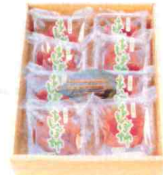
0008 あんぽ柿 70g×8玉 2,600円(税込)