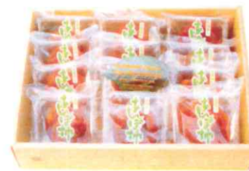
0010 あんぽ柿 70g×12玉 4,000円(税込)