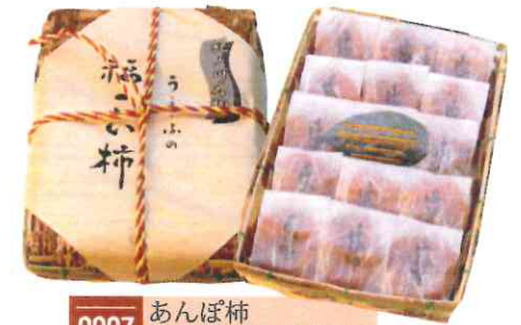
0007 あんぽ柿 60g×15玉(和紙袋) 4,500円(税込)