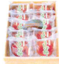
0009 あんぽ柿 70g×10玉 3,300円(税込)