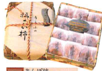
0006 あんぽ柿 60g×12玉(和紙袋) 3,600円(税込)