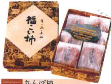
0005 あんぽ柿 60g×6玉(和紙袋) 2,000円(税込)