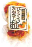
0004 ひとくちたねなし柿 100g(チップタイプ) 500円(税込)