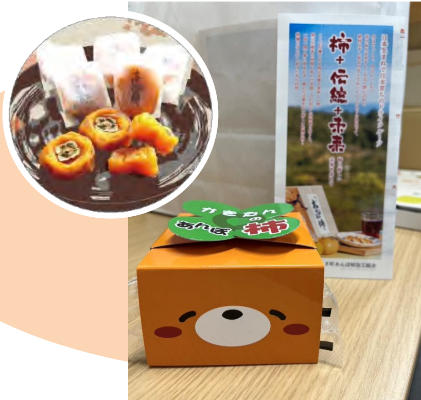
かきたん あんぽ柿×10箱

住所： 和歌山県伊都郡かつらぎ町妙寺1846番地の4 〒649-7113 電話： 0736-23-3112 H P： http://www.wakayama-anpo.com/