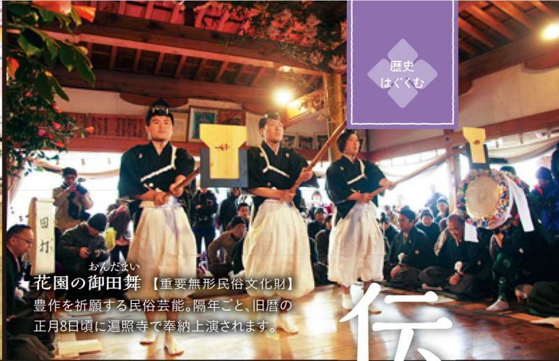
おんだまい 花園の御田舞 【重要無形民俗文化財】 豊作を祈願する民俗芸能。隔年ごと、旧暦の正月8日頃に遍照寺で奉納上演されます。

1月の第3日曜に、丹生都比売神社の楼門で行われます。田植えの様子を演じる農耕儀式で、五穀豊穡を祈ります。