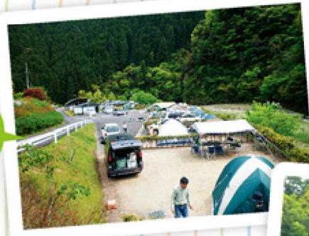
北寺オートキャンプ場