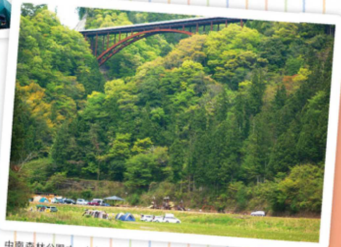
中南森林公園オートキャンプ場

有田川沿いにあるキャンプ場では、川遊びや魚釣りを楽しめます。トイレ、シャワー、調理場などが整備され、快適で本格的なアウトドアを思う存分満喫できます。