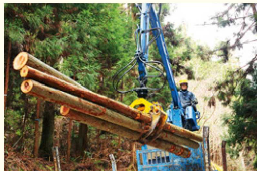
▲重機を使う作業もこなす

あるものになっていくよう、これ からも自分の能力を最大限、仕 事に生かしていきたいです。