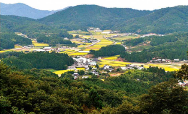
ニツ鳥居からの眺望

九度山の慈尊院から高野山への参詣道。1町(109m)ごとに町石と呼ばれる道標が建てられています。