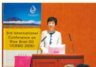
▲第3回国際こめ油会議にて