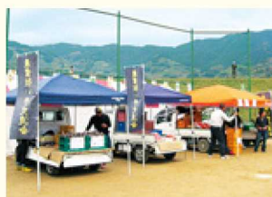
▲軽トラックでイベントに参加