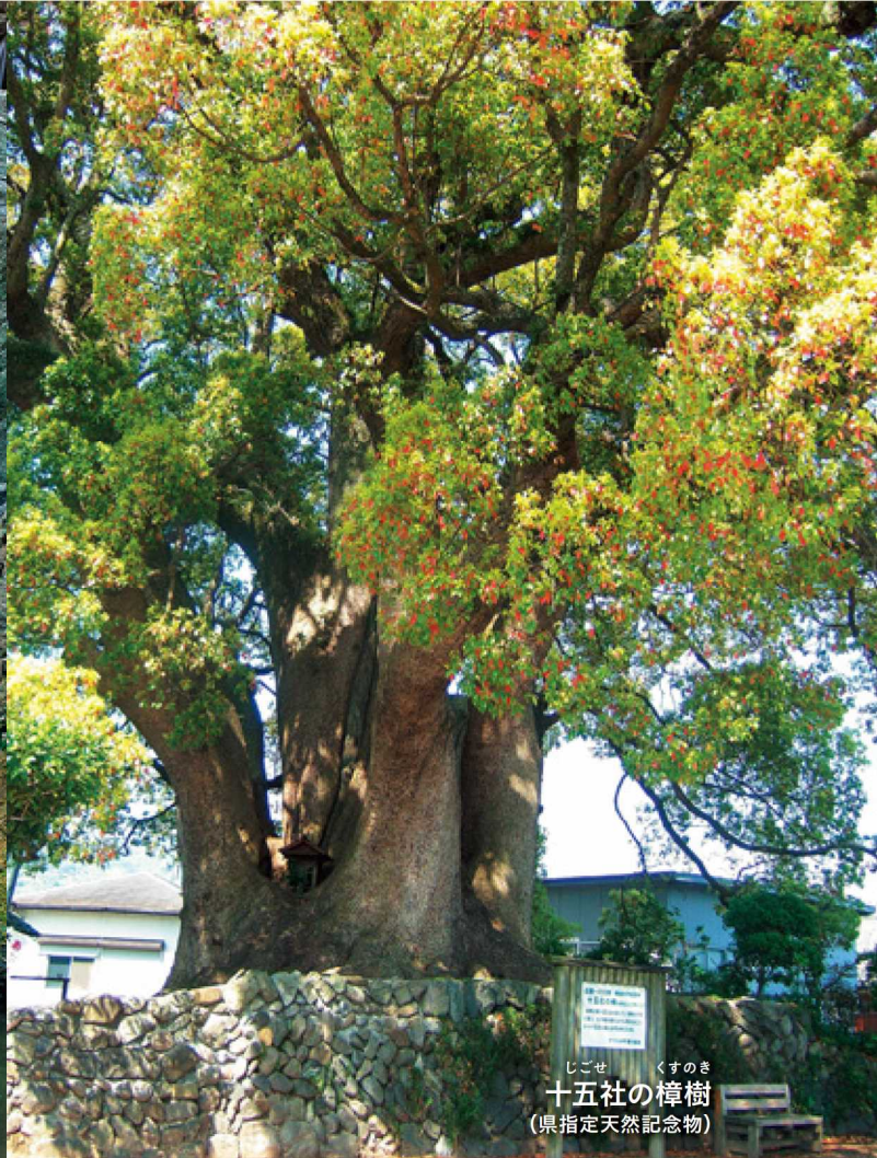
じごせ くすのき 十五社の樟樹 (県指定天然記念物)