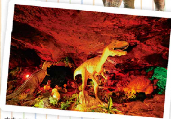
太古の昔にタイムスリップ

小原洞窟は、昭和40年頃まで銅を採掘していた鉱山跡。洞窟内は、夏は涼しく、冬はあたたか。恐竜を探しに、洞窟探検へ出かけませんか。