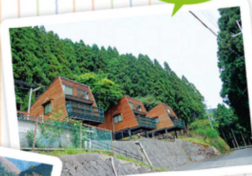
花園守口ふるさと村

田舎生活を体験できる宿泊施設。「花園守口ふるさと村」は、姉妹都市である大阪府守口市と造った交流施設。'新子ふるさと村」は、廃校を利用した宿泊施設です。