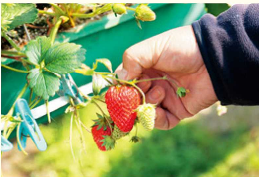
▲収穫したイチゴは市場ではなく直接洋菓子店などへ

喜びを感じています。困ったことや不安なことがあると、交流会の人同士で相談に乗ることもあり、みんなが支え合っています。これからは