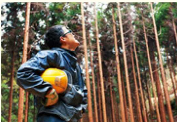
▲1か月かけて山の上から 谷の川まで間伐したことも