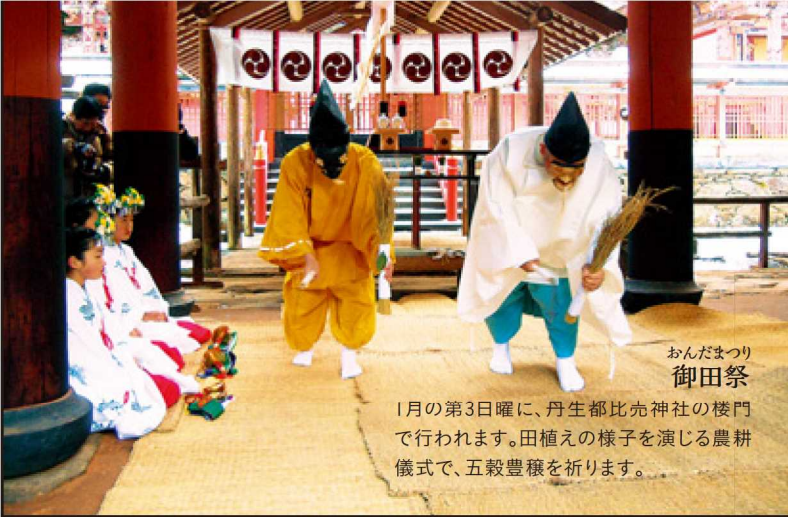
おんだまつり 御田祭

1月の第3日曜に、丹生都比売神社の楼門で行われます。田植えの様子を演じる農耕儀式で、五穀豊穡を祈ります。