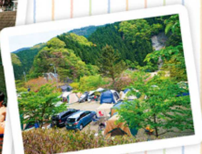
オートキャンプ場