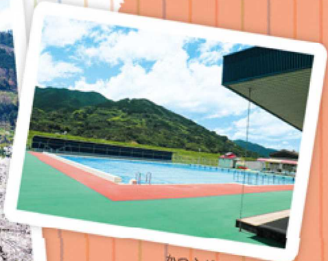
かつらぎ町民プール