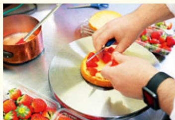
▲一つ一つ心を込めた逸品にリピーター続出

フランスの素朴な家庭の味に、かつらぎ町の食材を合わせながら、多くの方に楽しんでいただきたいですね。