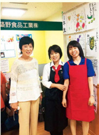
▲野菜フェスタ和歌山にブースを出展

あるこの地でお米の可能性を導き出し、人々の健康に寄与するような製品を生産できることに感謝しています。アジア最大の農産物であるお米を活用するビジネスや、「米の文化」のネットワークづくりを社員一丸となって取り組み、かつらぎ町の地から発信していきたいと考えています。