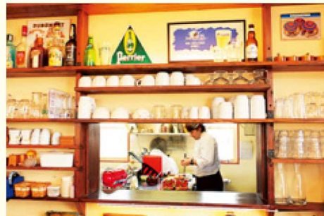
▲内装は自分たちで手がけ、あたたかい雰囲気のある店内に

かつらぎ町で、その豊かな自然に魅力を感じ、料理店を始めました。私が生まれた育ったフランスの家庭の味を大切に、地元野菜や果物をふんだんに使い、料理やお菓子を手づくりしています。特にお菓子は、イチゴやリンゴ、柿、桃のタルトなど、かつらぎ町の風土だからこそ作ることできるものばかり。四季折々のおいしさを詰め込んで、お客様をお迎えしています。クリスマスケーキを毎年買ってくださいる方、夏限定のランチを楽しみにしてくださいる方…、お客様の笑顔と「おいしかった」の一言にいつも励まされています。