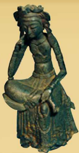
どうぞうぼさつはんかぞう 銅像菩薩半跏像 【重要文化財】 可憐な姿の小型の仏像。木造如意輪観音半跏像の胎内から、偶然発見されました。飛鳥時代後期。