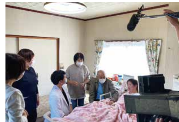
テレビ和歌山 特別番組 「在宅医療 自分らしく生きるため」の取材を受けました。

地域の訪問看護ステーションや居宅介護支援事業所と連携し、対象者が安心・安全な療養生活を送ることが出来るように支えています。