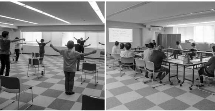
糖尿病フォローアップ教室の様子