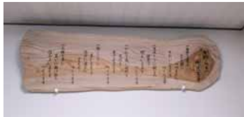
寄贈の町民憲章モニュメント