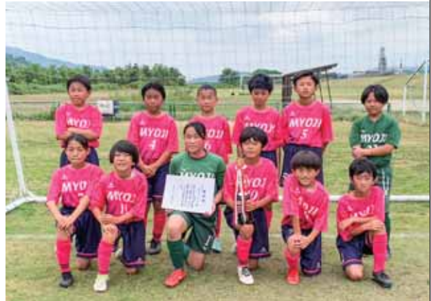
伊都予選出場メンバーの写真