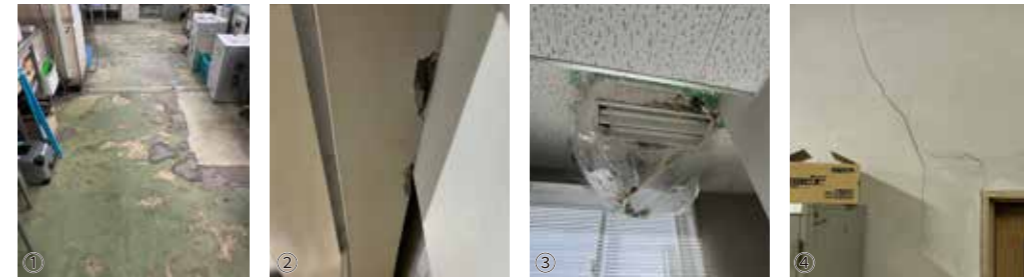
本庁舎の老朽箇所 ①床面の剥がれ②壁面の剥がれ③雨漏りの状態④壁面クラック