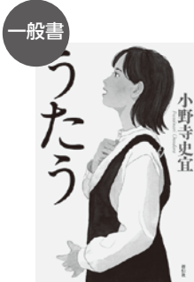
「うたう」 小野寺 史宜(著)