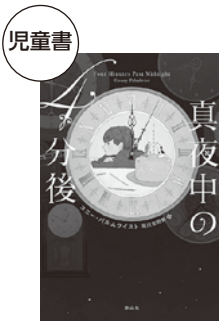
「真夜中の4分後」 コニー・パルムクイスト(作) まめふく(絵)