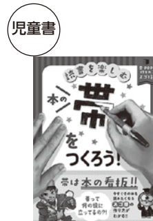
「本の帯をつくろう！」 「本のPOPや帯を作ろう」編集室(編)