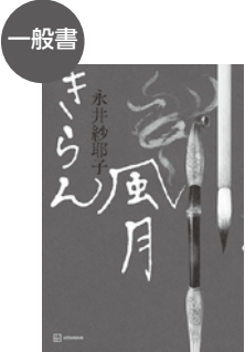
「きらん風月」 永井 紗耶子(著)