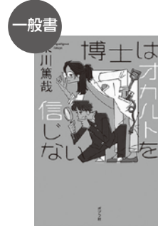
「博士はオカルトを信じない」 東川 篤哉(著)