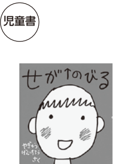
「せがのびる」 やぎゅう げんいちろう(作)