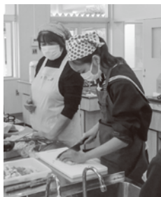
妙寺中学校への食育出前授業（地元食材を使った炊き込みご飯、豚汁、柿入りサラダ、柿ミルクの調理体験）の実習風景

地域に伝わる「食」や「農」の魅力を伝える活動や、町から委託を受けた小学校での食育学習などを通じて、子どもたちに「食農」への親しみや「心身が健康になる食」への理解を深めてもらう取り組みを行っています。