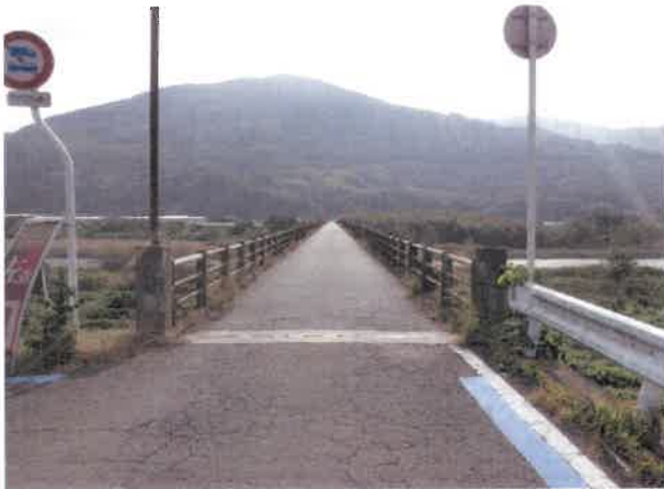
国道24号線側から撮影