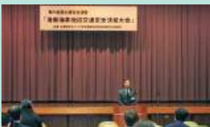
海南海草地区交通安全決起大会 海南支部