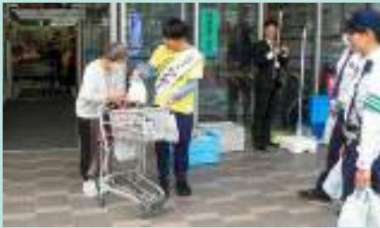
買い物客に交通安全啓発 橋本支部

～ あなたの交通安全協会会費が交通安全ボランティアの活動を支援しています ～ 各支部の交通安全活動だより (2026年春の全国交通安全運動などでの啓発活動等)