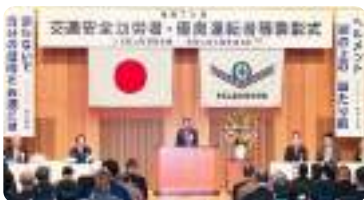
交通安全功労者・優良運転者等表彰