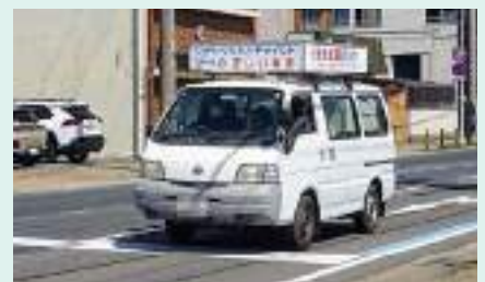
広報車で交通安全啓発 和歌山北支部