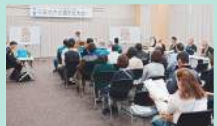
日高地方交通安全大会 御坊支部