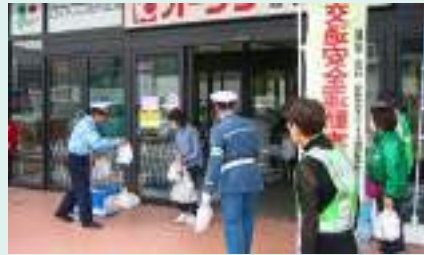
買い物客に交通安全啓発 かつらぎ支部