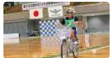
交通安全こども自転車と和歌山県大会