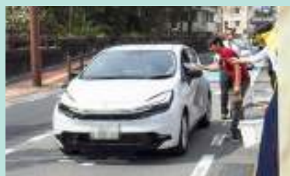
運転者に交通安全啓発 白浜支部