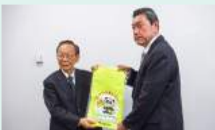
ランドセルカバー贈呈式 田辺支部