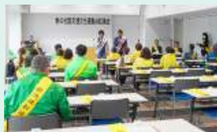
春の全国交通安全運動決起集会 有田湯浅支部