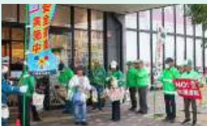
買い物客に交通安全啓発 和歌山東支部