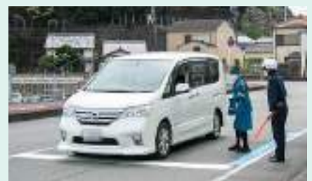
運転者に交通安全啓発 新宮支部