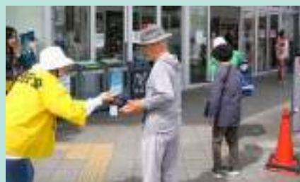
買い物客に交通安全啓発 和歌山西支部