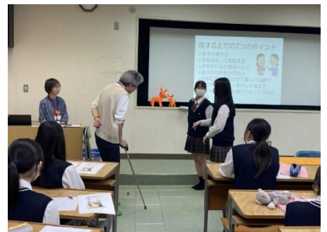
今年度の様子 (認知症サポーター養成講座)