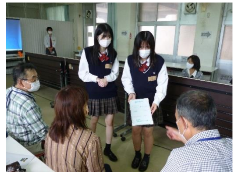
昨年度の様子(注文聞き)