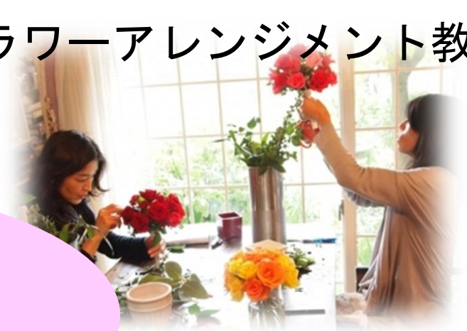
フラワーアレンジメント教室