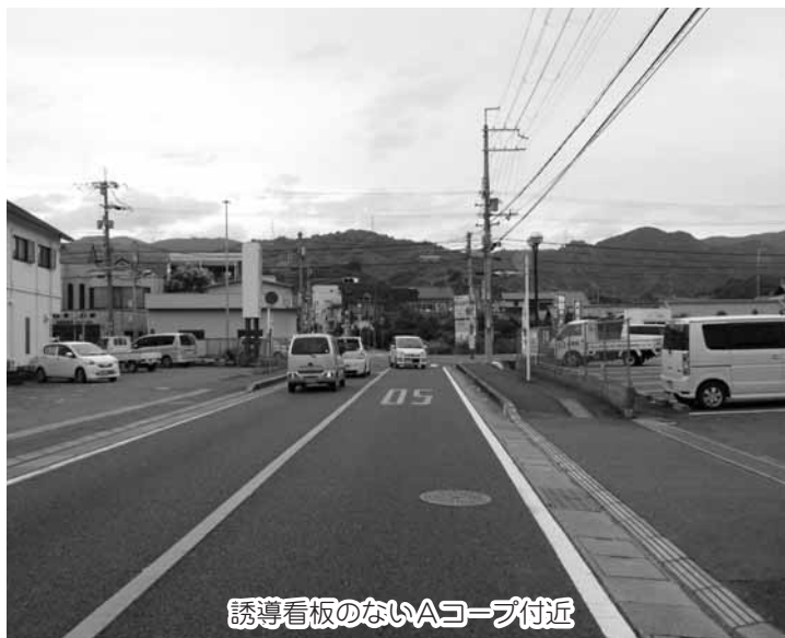
誘導看板のないAコープ付近

無償であっても利用するには改修が必要であり、どのような利用方法を考えているのですか。また、運営はどうするのですか。