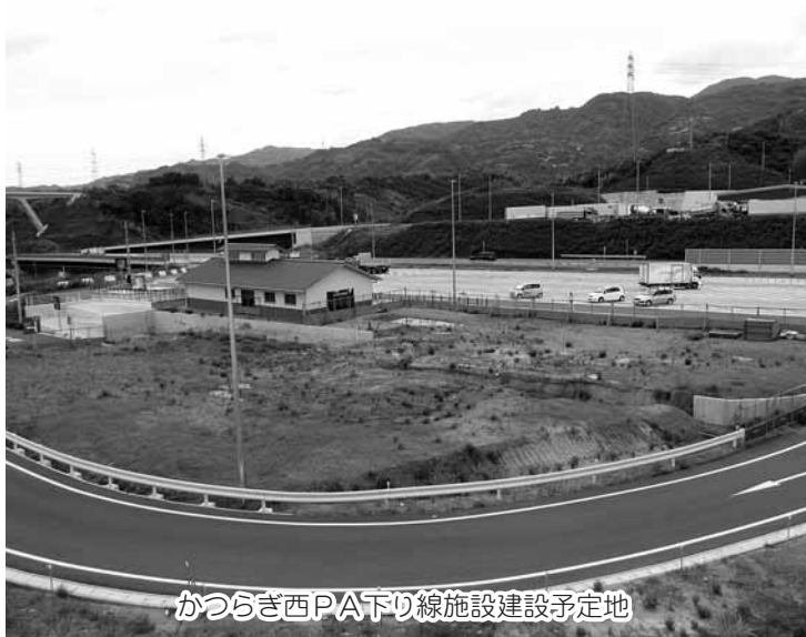
かつらぎ西PA下り線施設建設予定地