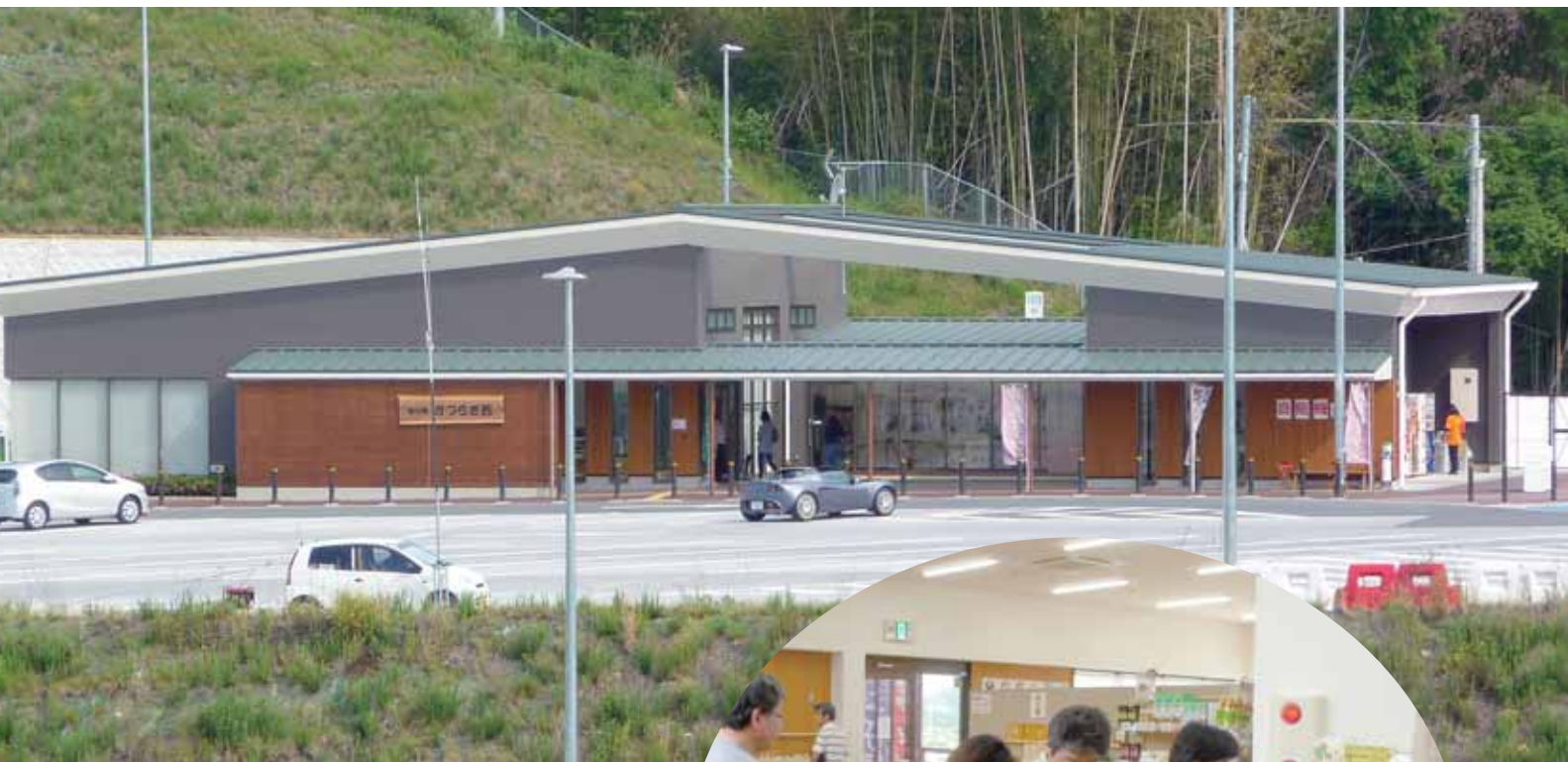
道の駅 かつらぎ西 (京奈和自動車道)