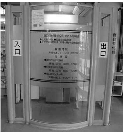
橋本市役所内自動交付機