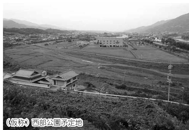
《仮称》西部公園予定地

なると思います。歴史資料館を建設してほしいという西部自治区の要望についてどのように考えますか。 町長 都市公園内への設置は難しいと思います。また道の駅についても国の用地ですので国との協議が必要となります。