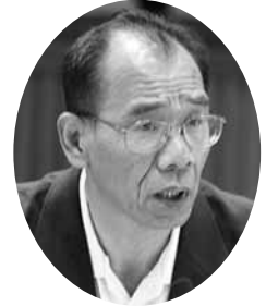
藤本 憲一 議員