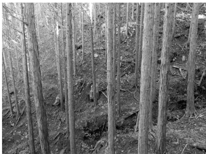
保水力が低下した山林

問 水源地流域の森林整備をすれば、すぐに水量が安定し飲料水の給水に心配がないということにはなりません。長期的に整備をすることで安定した水の確保につながるものと考えます。近年、谷川とか紀の川本流も含めて、水量が減少してきていることを、