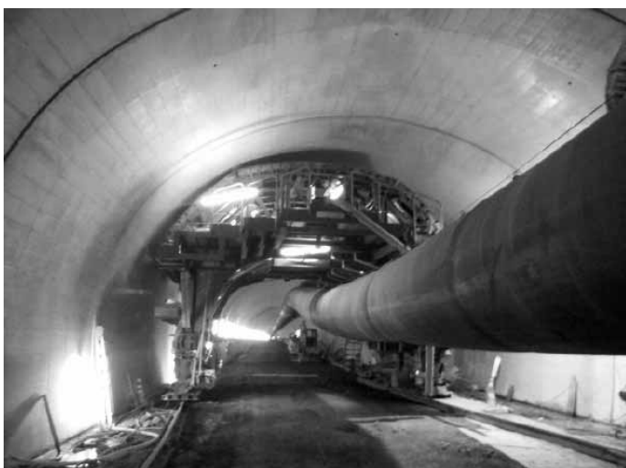
工事中の鍋谷峠トンネル

本町で暮らし、トンネルを利用して大阪へ通勤することが人口増の要因です。経済活性化として、本町の農産物などの買い物により、人、物、お金、情報の流れが相当変わっていくと思います。